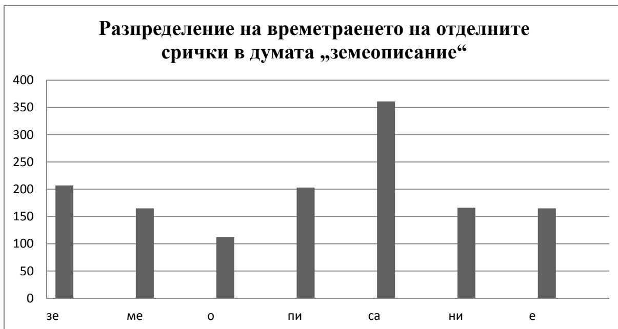
Таблица 1. Акустични стойности на началната сричка зе- в първата група единици

Графичното представяне илюстрира най-високата стойност на времетраенето на сричката – носител на ГЛЮ (26.2%). На второ място е началната сричка зе- (15.2%), която отстои от ГЛЮ на три срички. В случая принципът за постепенно редуциране на стойностите на ударените срички се наблюдава само при -ни- и -о- , след което стойностите нарастват.